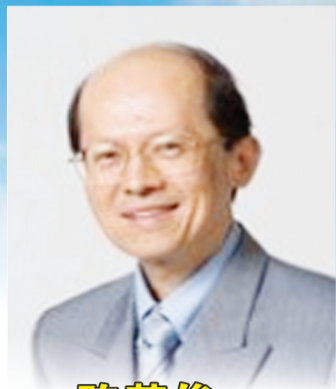
新加坡陈英俊医生供稿